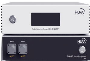
실내형 광대역 전파 수신기(EdgeRF) indoor wideband radio receiver(EdgeRF)