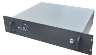
GNSS 혼신 모니터링 시스템(EdgeRF-GNSS) GNSS Radio Interference Monitoring System(EdgeRF-GNSS)